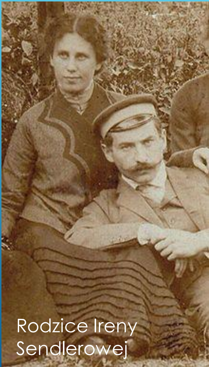
Rodzice Ireny Sendlerowej